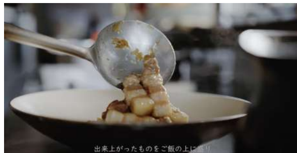
(制作イメージ) 清澄白河 中華料理 O2(オーツー) ミシュラン掲載店