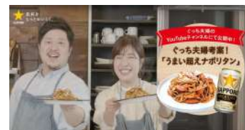
(制作イメージ) サッポロさま YouTube用動画