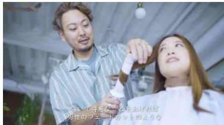
(制作イメージ) 3PIECE https://youtu.be/816M0LqIrJI