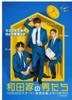
ドラマ テレビ朝日 和田家の男たち