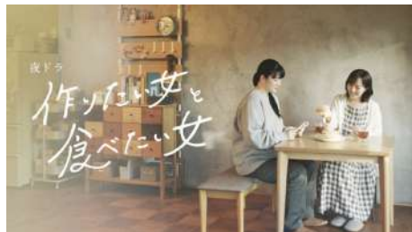
ドラマ NHK 作りたい女と食べたい女