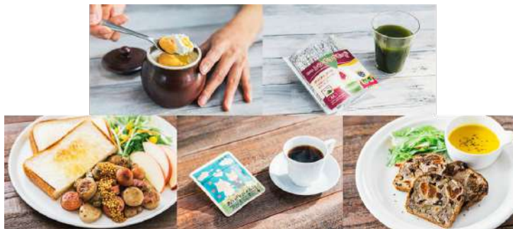
(制作イメージ) 東京都町田市さま 事業者の商品紹介写真