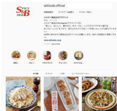
(制作イメージ) エスピー食品さま 公式Instagramの運用支援