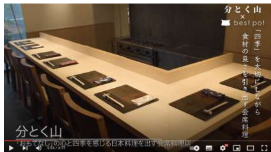
(制作イメージ) 広尾 高級日本料理 分とく山

飲食店の外観・内装・料理・人物インタビューなどを中心にした紹介動画を制作しています。 WEB、ホームページ、店頭を集客用動画サイネージで使用いただいています。