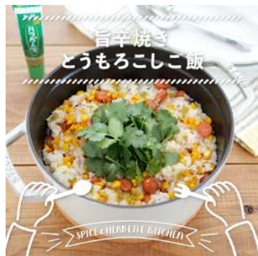
(制作イメージ) エスピー食品さま Instagram投稿用 動画