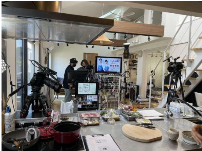
(現場イメージ) 高島屋さま ライブ配信の様子

カメラマンと配信オペレーターのアサインおよび機材手配をトータルでサポートします。 ライブ配信に長けたフードアシスタントもあり、安心のオンラインライブ配信ができます。