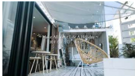
(制作イメージ) The Holiday https://youtu.be/nEPniC8_f6s

セレクトショップ、保育園、美容院、書店などを店舗を構えた顧客に向け プロモーション動画の企画立案、制作まで一貫して提供しています。