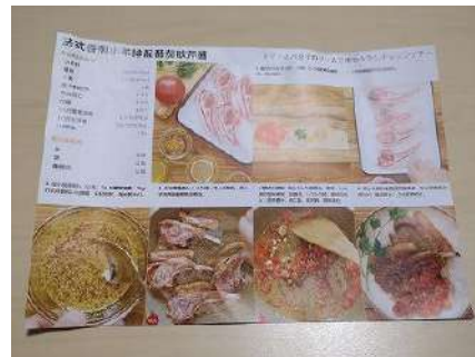
(制作イメージ) オイシックス・ラ・大地さま ミールキットのメニュー開発