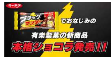
(制作イメージ) ユーラクさま 広告用動画