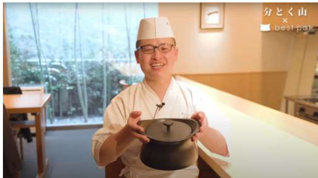
(制作イメージ) best potさま 飲食店での商品紹介動画