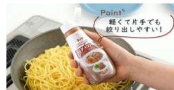
(制作イメージ) キューピーさま WEB用CM動画