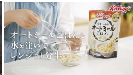
(現場イメージ) ケロッグさま オートミールごはん