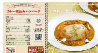
(制作イメージ) エスピー食品さま スーパー売場販促用 動画