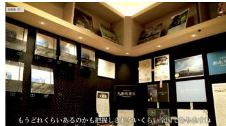
(制作イメージ) 天狼院書店 https://youtu.be/hLJarVki-Yw