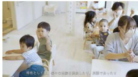
(制作イメージ) mlisa https://youtu.be/OVCQR4WNnas