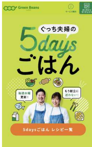
(制作) イオンネクストさま 5days特設ページ