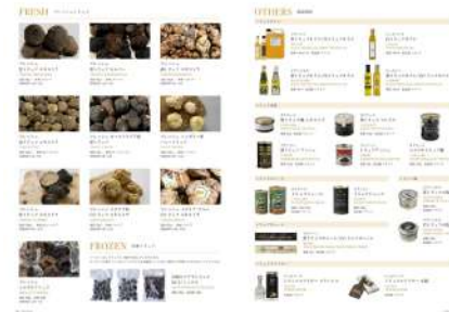
(制作イメージ) 鯉沼紹介さま 紙媒体+デジタルパンフレット制作