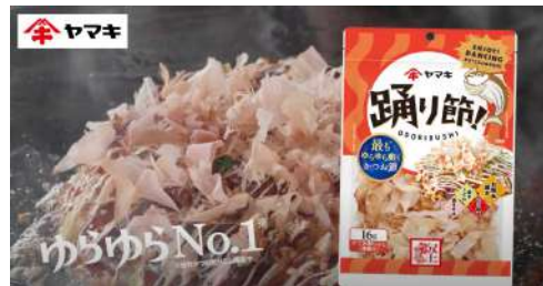
(現場イメージ) ヤマキさま ゆらゆらNo 1! 『踊り節』